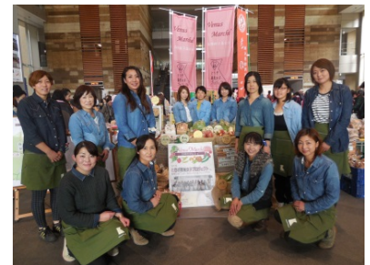
とちぎ農業女子プロジェクト