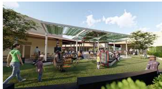
屋外スペースイメージ