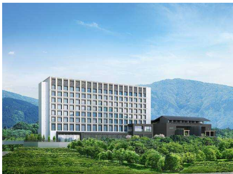
「HOTEL CLAD」(ホテル クラッド)・日帰り温泉施設「木の花の湯」(このはなのゆ) 外観(イメージ)

小田急電鉄株式会社(本社:東京都新宿区 社長:星野 晃司)と株式会社小田急リゾート(本社:神奈川県相模原市 社長:端山 貴史)は、「御殿場プレミアム・アウトレット」(静岡県御殿場市 運営:三菱地所・サイモン株式会社)の第4期増設エリア内に新設するホテル「HOTEL CLAD」(ホテル クラッド)と日帰り温泉施設「木の花の湯」(このはなのゆ)の開業日を2019年12月15日(日)に決定し、宿泊予約を2019年7月8日(月)から開始します。あわせて、各施設の料金、メニュー等の詳細が決定いたしましたのでお知らせします。