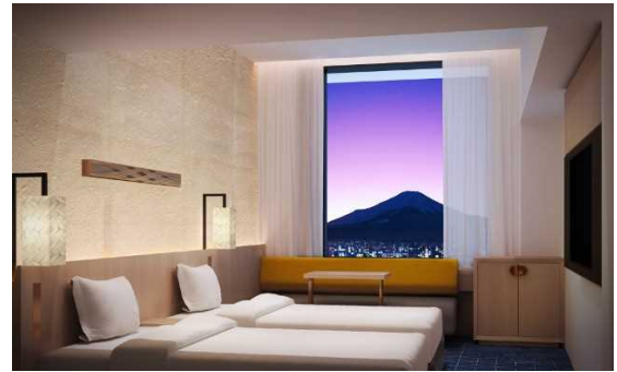
富士ビューツインルーム(イメージ)