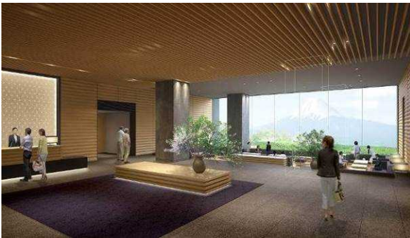
フロント・ロビー(イメージ)