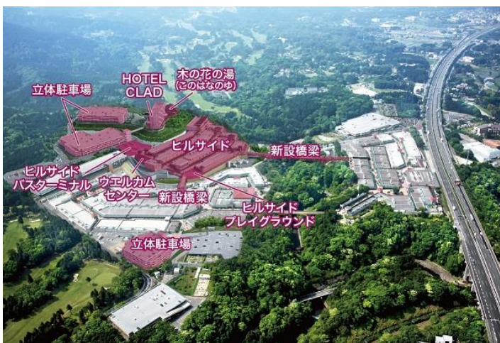
第 4 期増設後 鳥瞰図 イメージ

国内外のお客様に“新たなアウトレットの楽しみ方”を提案しようと、「ヒルサイド」の開業に先駆け、昨年 12 月 15 日には小田急グループの「HOTEL CLAD」と日帰り温泉施設「木の花の湯」が開業しました。