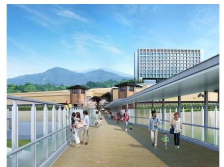
新設の橋からみた「ヒルサイド」イメージ