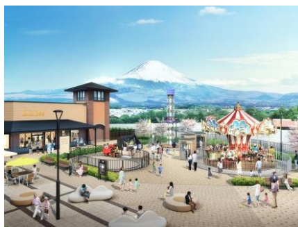
「ヒルサイド」エリアイメージ