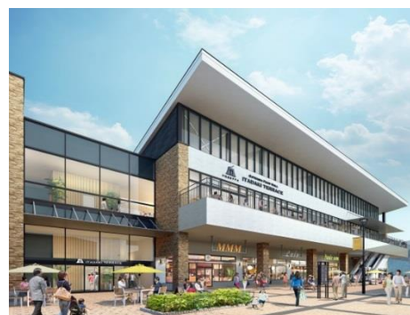
「いただきテラス」外観イメージ