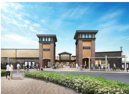
「ヒルサイド」エントランスイメージ

御殿場プレミアム・アウトレットは、アメリカ生まれのアウトレットとして日本に開業して今年で20年。アウトレットの枠を超え“日本を代表する唯一無二のショッピングリゾート”へとアップグレードし、エリアの広域観光拠点となる施設を目指します。