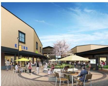
「ヒルサイド」イメージ

また、飲食店舗を集めたフードエリアを中心に、飲食や食物販の店舗を拡充。マカロン・パリジャンを生み出した老舗パティスリーメゾン「ラデュレ」や、静岡県のソウルフード「炭焼きレストランさわやか」、箱根強羅名物“豆腐かつ煮”が人気の「田むら銀かつ亭」などがアウトレット施設日本初出店。幻のコシヒカリ『雪ほたか』を美味しく味わえる食堂スタイルの新業態レストラン「サロン ギンザ サボウ こめ食堂」、トランジットジェネラルオフィスが手がけ、脇屋友詞氏が監修する点心や汁なし担々麺を提供する新業態「ファンファン飲茶」もお目見えいたします。