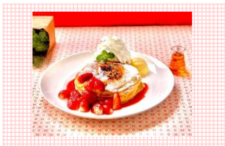
いちごのパンケーキブリュレ 930円（税込）