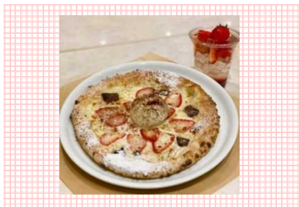
三田市産紅ほっぺとショコラのスモアピッツァ 748円（税込）

三田市産紅ほっぺとショコラの相性がぴったりのドルチェピッツァです。 ストロベリースカッシュ（単品 550円/セット 495円）を添えていちご三味を楽しめます。