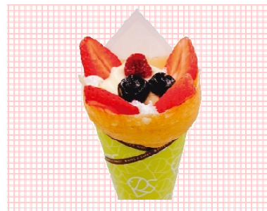
三田市産いちごの ミックスベリークレープ 649円（税込）

イチゴ・ブルーベリー・ラズベリーの三種類の味を堪能いただける贅沢なクレープです。