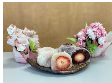
※松栄堂「いちご大福」（イメージ）