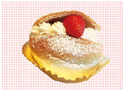
神戸三田あんぱん（いちご） 300円（税込）

しっとりした生地に低糖の粒あん、ホイップクリーム、三田市産のいちごをトッピングした特別メニューです。