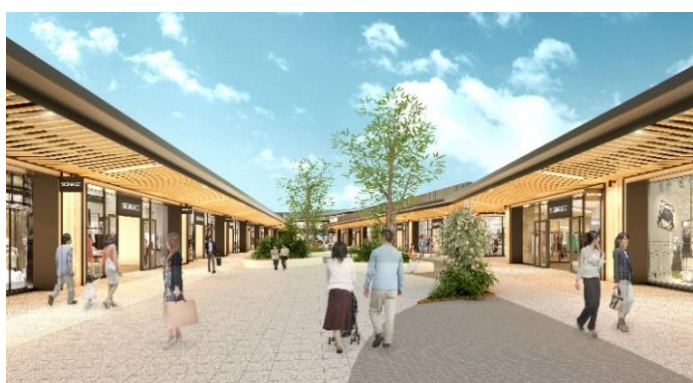
ふかや花園プレミアム・アウトレット イメージ②

URL： https://www.premiumoutlets.co.jp/pressroom/