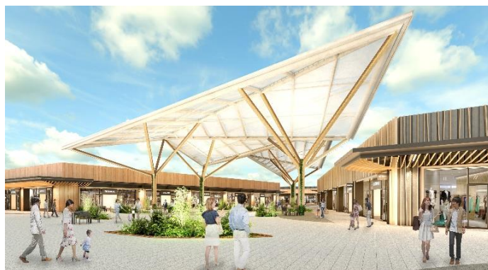
ふかや花園プレミアム・アウトレット イメージ④