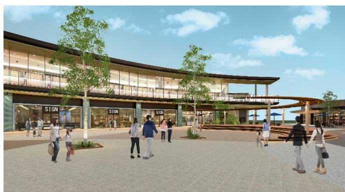
ふかや花園プレミアム・アウトレット イメージ③