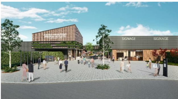
ふかや花園プレミアム・アウトレット イメージ①

当社は、広域商圈の特性を活かし、埼玉県北西部の魅力・価値を発信するとともに、地域の発展に貢献する施設・拠点づくりに取り組んでまいります。