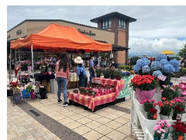
オハナマルシェイメージ