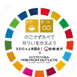
SDGs オリジナルシールイメージ