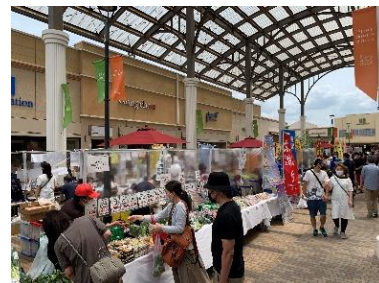
千葉県観光物産展

https://www.premiumoutlets.co.jp/shisui/events/news55714.html