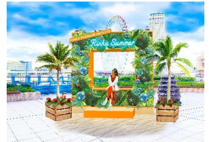
装飾イメージ (Early Summer)

海を望むシーサイドアウトレットにふさわしい、美しいリゾート感をイメージしたフォトスポットが期間限定で登場。初夏(Early Summer)には「Botanical (ボタニカル)」、真夏(Mid-Summer)には「Tropical (トロピカル)」と、季節で異なるテーマの装飾が楽しめます。