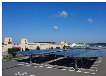
カーポート型太陽光発電設備（あみ/酒々井）