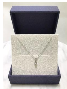
Vendome Aoyama プラチナ・ダイヤモンドネックレス ※イメージ