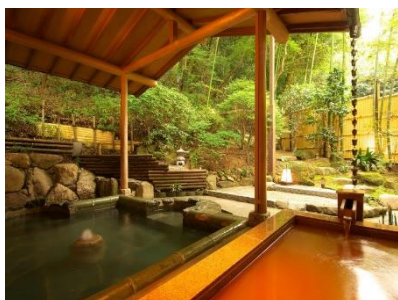
有馬温泉旅館 宿泊優待券 10 万円分 ※イメージ