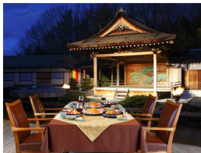
三田屋本店 ーやすらぎの郷ー ペアお食事券(ロースステーキコース) ※イメージ