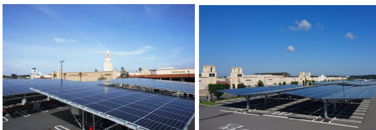
カーポート型太陽光発電設備(あみ/酒々井)