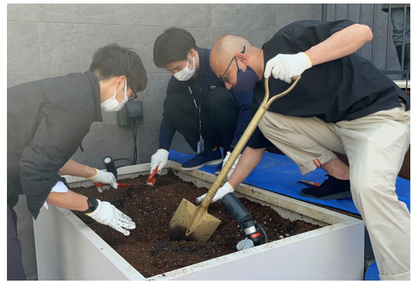
② 堆肥を均一にします