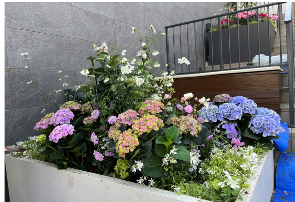
④ アジサイの花壇ができ上がりました