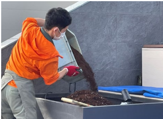
① 再生堆肥を花壇に投入します