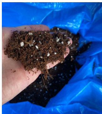
生成された再生堆肥