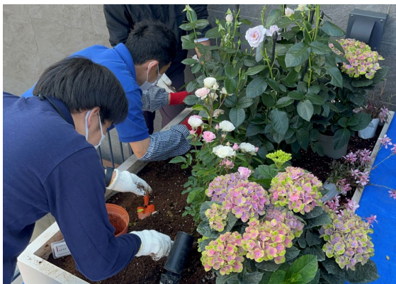
③ 花を植えていきます