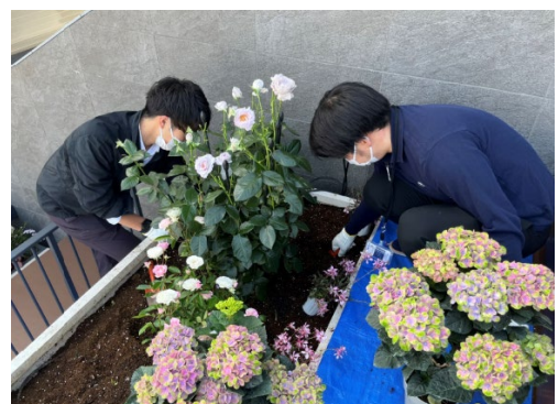
再生堆肥を使った植え替え作業に社員も参加