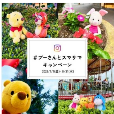
投稿写真イメージ