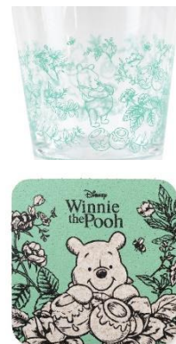
ギフトセットイメージ