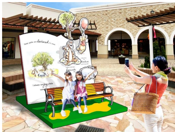
フォトスポットイメージ画像