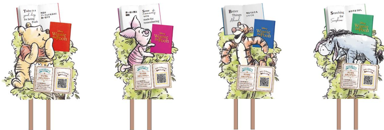
デジタルスタンプラリー看板イメージ画像