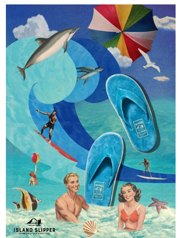
▲ISLAND SLIPPER イメージ