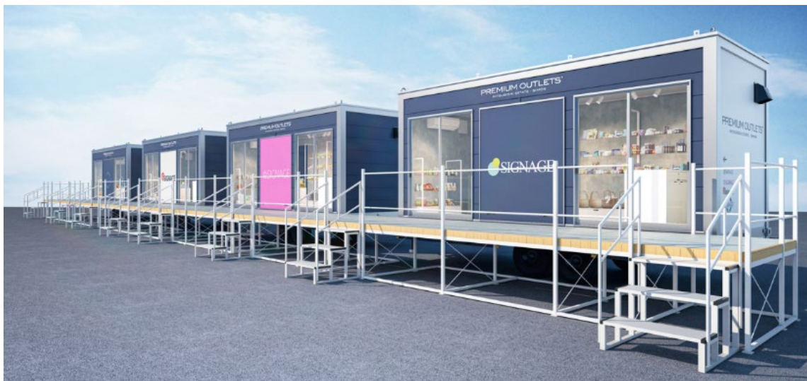
▲オンラインでの買い物と実店舗のショールーム機能を融合した「プレミアム・アウトレット サテライト」店舗イメージ

三菱地所・サイモン株式会社は、株式会社富士急ハイランドと連携し、2022年7月23日（土）～2022年9月25日（日）の期間、富士急ハイランド（山梨県富士吉田市）に、オンラインと実店舗が融合したOMO型店舗「プレミアム・アウトレット サテライト」を期間限定でオープンします。プレミアム・アウトレットの山梨県およびアミューズメント施設への出店は初であり、アトラクションの合間にアウトレットショッピングという新しい楽しみ方をご提供します。