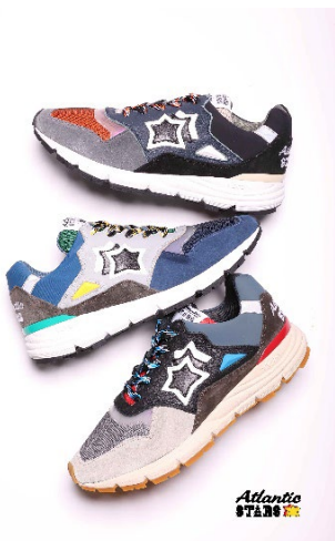
▲Atlantic STARS イメージ

ウェブサイト： https://www.premiumoutlets.co.jp/sp/satellite/