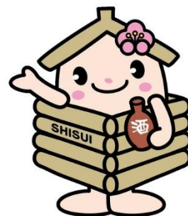
酒々井町マスコットキャラクター 井戸っこ (しすいちゃん) イメージ