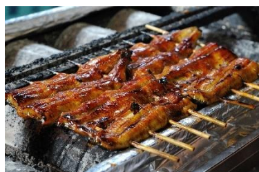
「川豊」 うなぎ蒲焼セット