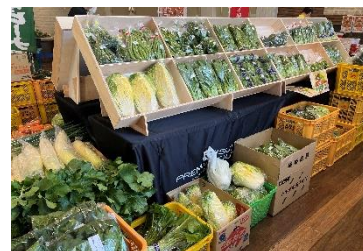
しすいマルシェ 過去開催時の様子