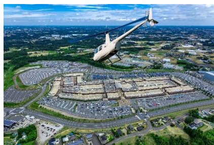
酒々井プレミアム・アウトレット 遊覧ヘリクルージング 2名様ペア乗車券