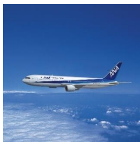
「全日本空輸（ANA）」 ANA 旅行券8万円分