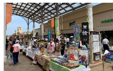
ちばI・CHI・BA 過去開催時の様子