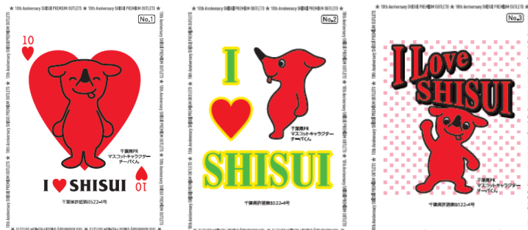
「チーバくん」トレーディングカード イメージ（全6種類）