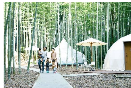
「ザ・バンブーフォレスト」 1泊2名様宿泊体験