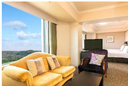
「ヒルトン成田」 スイートルーム1泊2名様 &ホテルクレジット1万円分