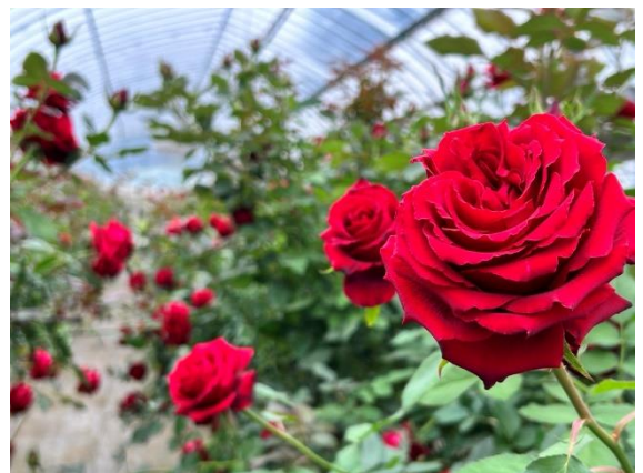
ROSE LABO 深谷農園での栽培の様子