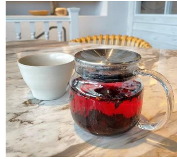
フレンチトースト&ローズティー イメージ