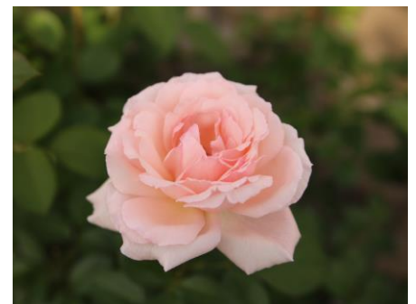
化粧品に使用されている バラ(「24」)の栽培の様子