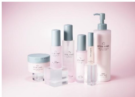
ローズブースターセラム イメージ