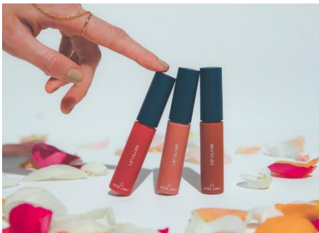
ローズリップグロス イメージ