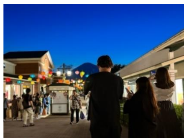
ランタンと富士山は記念撮影スポットに