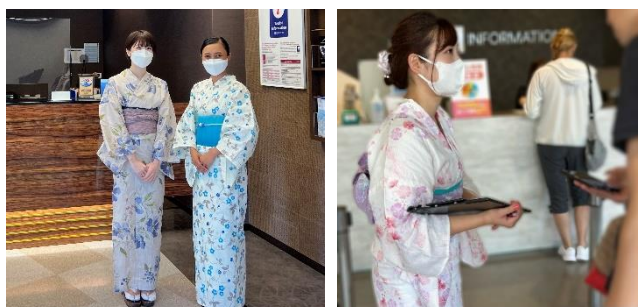
インフォメーションスタッフも浴衣姿でご案内

開催日は、インフォメーションスタッフも浴衣姿でお客様のご案内を行います。浴衣や甚平でご来場のお客様には特典もご用意していますので、ぜひインフォメーションセンターにお立ち寄りください。