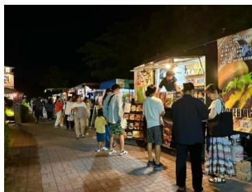
キッチンカーも賑わいました