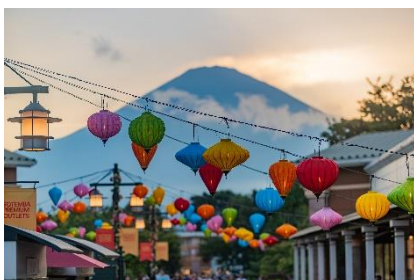
色鮮やかなランタンと富士山

食欲をそそる香りが漂うキッチンカーが集まる「フード フェスタ」も賑わいました。19時すぎにはケバブやハンバーガー、ソーセージにビールなど食事を楽しみながら、花火が見えるテラス席でのんびりと過ごされるお客様が多く見られ、「打上花火の実施を目指して夜に来場しました。」という声もありました。