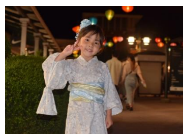
多くのお客様が浴衣で来場されました