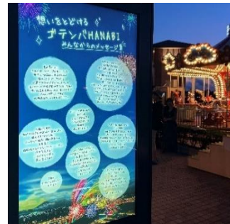
お客様からのメッセージはサイネージでも紹介しています