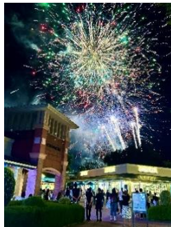
打上花火のクライマックス