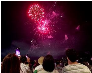
大迫力な花火に歓声があがりました

ご応募いただいた、総数約100件の心温まる素敵なメッセージは、「想いをとどけるゴテンバ HANABI」開催日に場内のデジタルサイネージでご紹介しています。