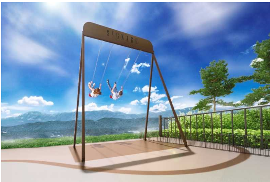
大型ブランコ「トキメキスウィング」イメージ（パース）

土岐プレミアム・アウトレット（所在地：岐阜県土岐市 運営：三菱地所・サイモン株式会社）では、大型のブランコ「トキメキスウィング」(商標登録出願中)や、コイン式の遊具などが楽しめるプレイグラウンドを2023年11月1日（水）にオープンします。