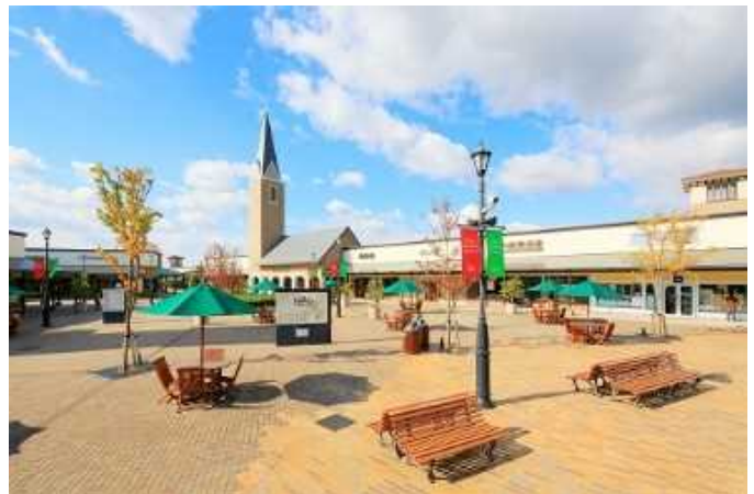
メープルコート（画像）