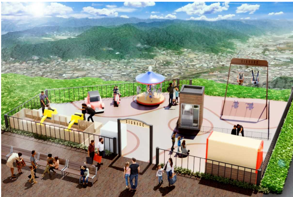
プレイグラウンドイメージ (パース)