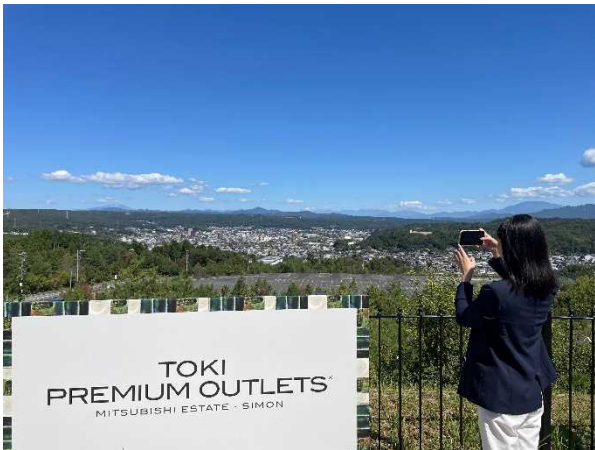
メープルコートの展望エリアより（画像）

ウェブサイト： https://www.premiumoutlets.co.jp/toki/