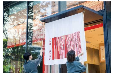
▲アナザー・ジャパン

グッドデザイン賞は、三菱地所グループとして、1998年度に「クイーンズスクエア横浜」で初めて受賞。2003年度からは21年連続の受賞となります。