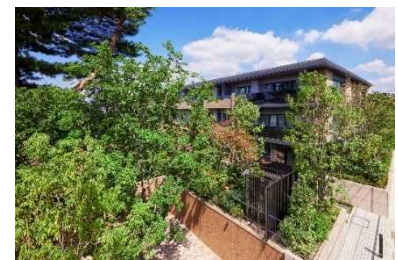
▲「ザ・パークハウス 自由が丘ディアナガーデン」外観

三菱地所グループは、今後も「人を、想う力。街を、想う力。」というブランドスローガンのもと、まちづくりを通じて社会に貢献してまいります。