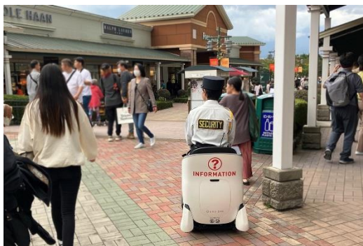
UNI-ONEの活用イメージ ※テスト運用日に撮影