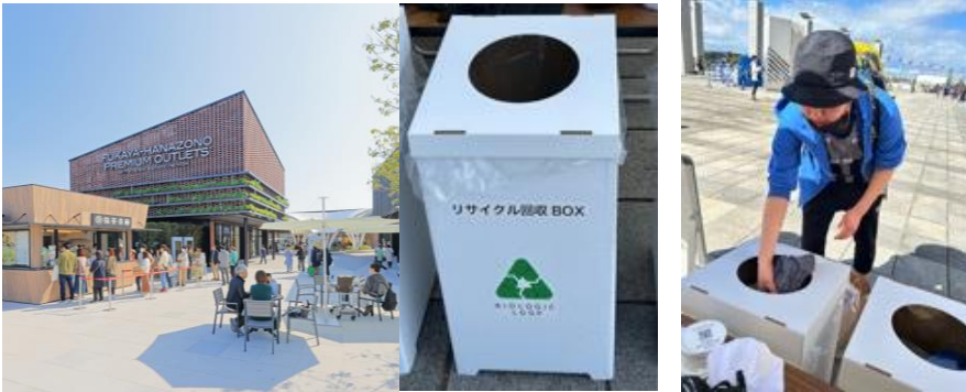
ふかや花園プレミアム・アウトレットでの回収イメージ