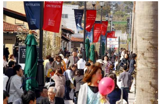
※2004年3月12日開業当日様子

チエルシージャパン株式会社（当時/現 三菱地所・サイモン）は、都市部から一定の距離を保ち、主要幹線道路からアクセスが良く、視認性の高い郊外立地への出店という戦略のもと、九州自動車道・長崎自動車道・大分自動車道がクロスする交通の要衝、鳥栖ジャンクション至近に「鳥栖プレミアム・アウトレット」を開業。車でのアクセスの良さや大型アウトレットセンターとしての強みを生かし、広域からの誘客に寄与、また、「有田焼」や「波佐見焼」の陶磁器、地酒などのエリアの特産品や、有名温泉地・観光施設など佐賀県および周辺エリアの魅力発信にも積極的に取り組み、地域の発展と活性化に努め、ともに発展してまいりました。また、日本のお客様だけでなく、台湾、香港、タイなどの東アジア、東南アジアからのお客様にも支持され、ご来場いただいています。